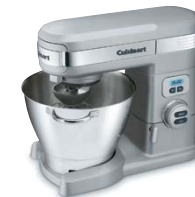
Batteur sur socle

Cuisinart offre une vaste gamme de produits de première qualité qui vous facilitera la tâche dans la cuisine. Essayez nos appareils de comptoir et nos batteries de cuisine, et... Savourez la bonne vie MD .